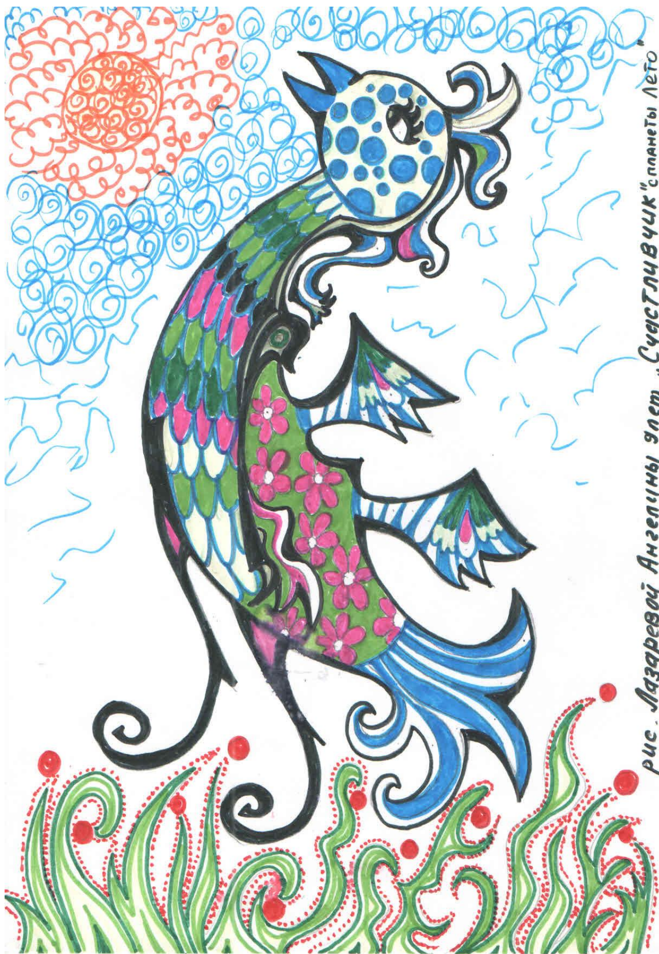
рис. Лазаревой Ангелины элет „Счастьлчвччк“спланеты Лето